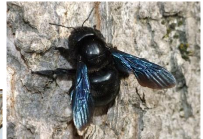
Abeille charpentière Xylocopa violacea (Pierre Falatico, 2010)