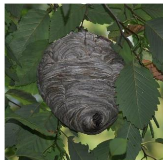
The High Fin Sperm Whale, 2011

Très souvent construit dans un buisson à faible hauteur, le nid peut atteindre une taille de 25 cm en fin de saison. De couleur grise, son ouverture de petite taille est située à la base du nid et légèrement excentrée.