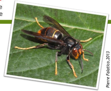
Pierre Falatico, 2013

Le frelon asiatique est très souvent confondu avec le frelon européen. Voici comment les différencier :