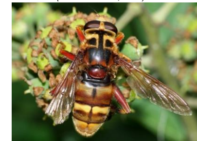
Milésie faux-frelon Milesia crabroniformis (Pierre Falatico, 2009)