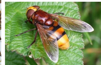
Volucelle zonée Volucella zonaria (Pierre Falatico, 2005)