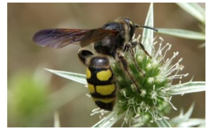
Scolie Colpa sexmaculata (Pierre Falatico, 2010)