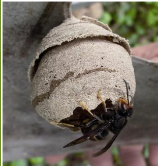
Basile Naillon, 2012

Au printemps, la femelle fondatrice construit seule un nid primaire dans lequel elle élève la première génération d'ouvrières. Ce nid de petite taille est souvent construit à faible hauteur.