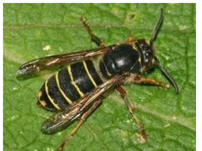
Guêpe des buissons Dolichovespula media (Jeremy Early, 2010)