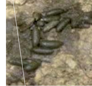
Identification du NUISIBLE

Le campagnol des champs s'adapte à tous les types de sols bien qu'il préfère les sols argilo-calcaires.